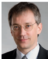
Dr. Peter Müller Stiftung Gesundheit